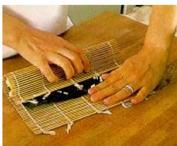
A esteira de bambu é usada para enrolar o sushi

Preparar estas delícias orientais não é tão difícil quanto parece. Primeiro tenha à mão alguns equipamentos que serão essenciais para facilitar o preparo. Veja o que você vai precisar: