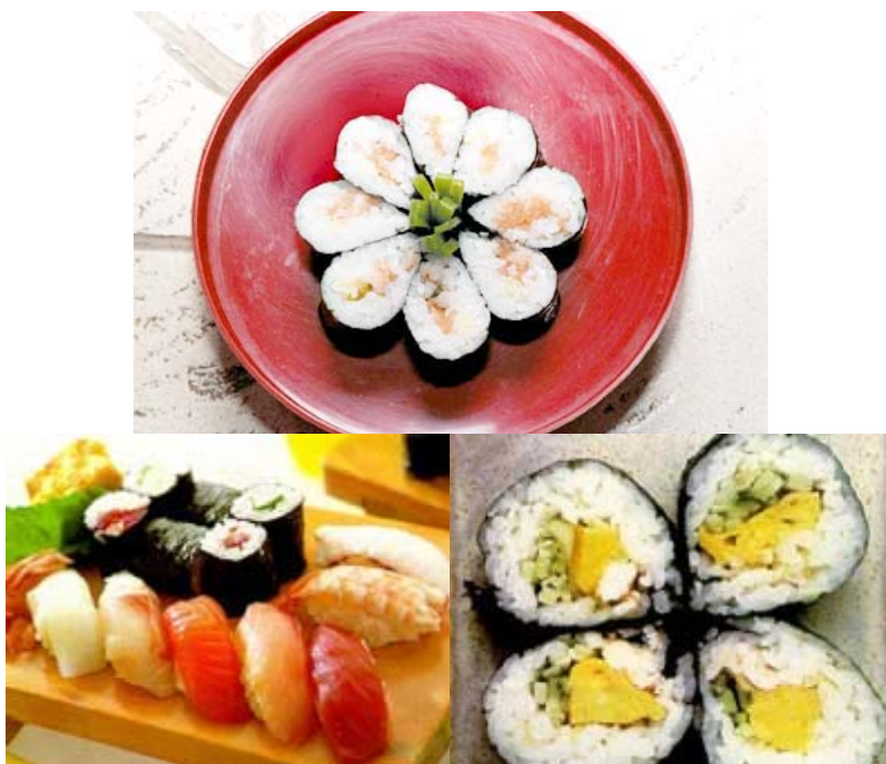
Os pratos japoneses são decorados com cerâmica trabalhada ou madeira decorada